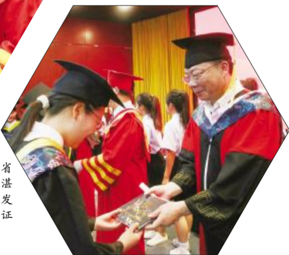
校党委书记、省政府教育督导专员湛俊三教授为学生颁发毕业证、授予学位证书。