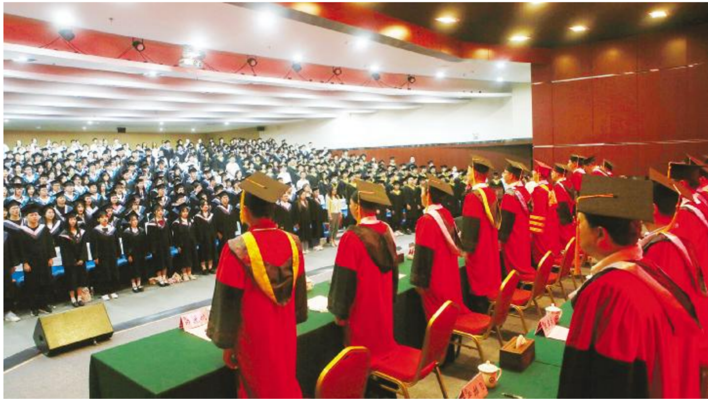
毕业典礼暨学位授予仪式现场。

人生并非一番风顺,不如意也有十之八九。只要我们不自怨自艾,在挫折中,调整我们的心态;在磨难中,磨炼我们的意志;在逆境中,如傲霜的菊花,坚挺我们的腰板,咬紧牙关,是困难,就总会被我们打败。重要的是,要有克服困难的勇气,我相信,黑暗就总会迎来黎明,是金子就总会发光,是耐寒的花儿就总会吐露芬芳。