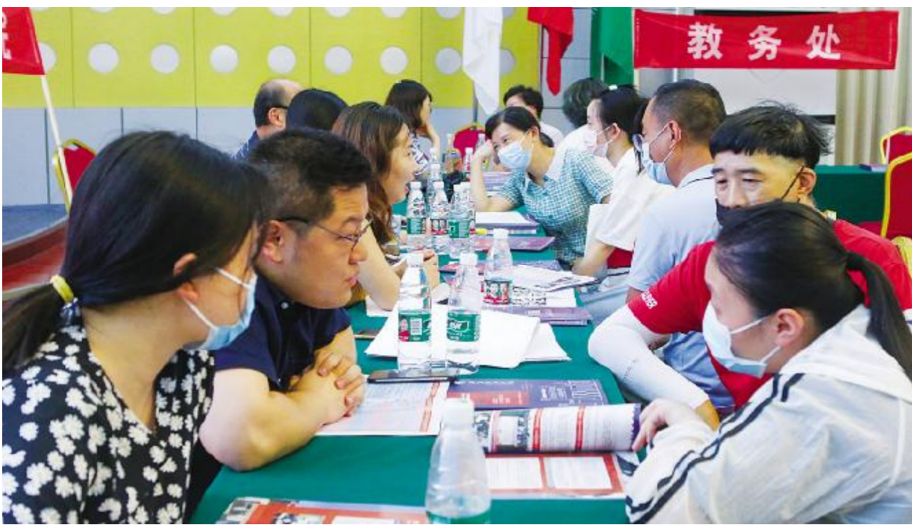
我校专业培养特色。在线全面展示我校的办学条件和丰富的校园文化生活。学校为考生及家长提供咨询服务。

开放日期间,学校向社会公众开放校园,全方位展示功能齐全的教学设施和多彩的校园文化。学校图书馆、智能制造实验实训中心、大数据人工智能智慧创新工场、东艺美术馆等处有专业老师现场讲解,帮助考生和家长深入了解