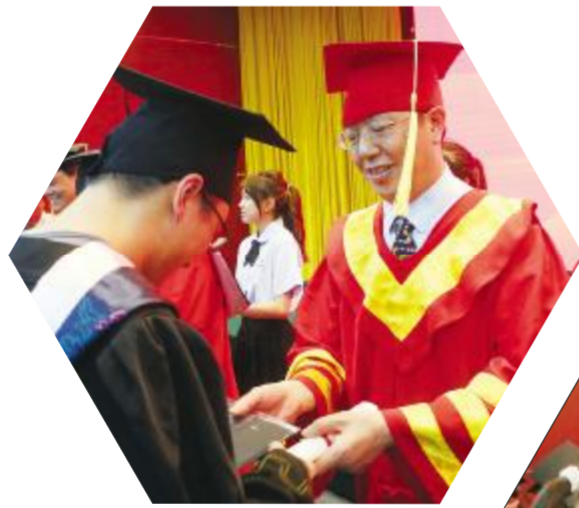
校党委副书记、校长李冬生教授为学生颁发毕业证、授予学位证书。