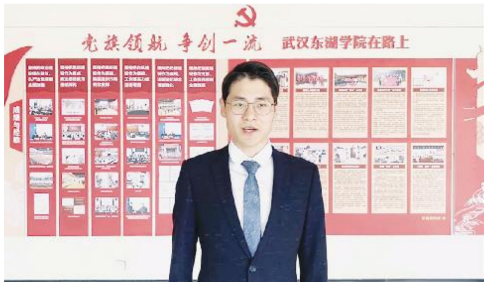
“党史故事大家讲”短视频评比活动。

学校积极参加国家和省级网络文化活动,我校师生作品《致新时代》《知识抗疫》分获第五届、第四届“全国大学生网络文化节”和“全国高校网络教育优秀作品推选展示活动”音频类二等奖和书画设计类三等奖。在2020年疫情期间,学校为由张伯礼院士带领的第三批国家援鄂中医医疗队提供住宿生活保障服务,同时,广大的师生,特别是师生党员都参与到了当地的抗疫,我们把这些故事采编成册,编辑了《听他们说》《抗疫故事集》《张伯礼院士在武汉的82天》《抗疫作品集》等作为我们思政教育的素材。